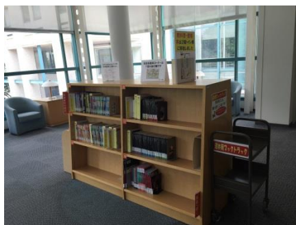
二階ブラウジングルーム